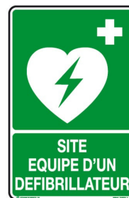
Pictogramme de signalisation