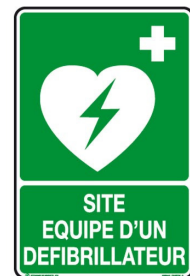
Pictogramme de signalisation

La réglementation oblige les établissements recevant du public de catégorie 1 à 4 à s'équiper d'un défibrillateur automatisé externe. L'Observatoire recommande de les installer dans tous les établissements d'enseignement, à des emplacements adaptés, connus de tous et en nombre suffisant.